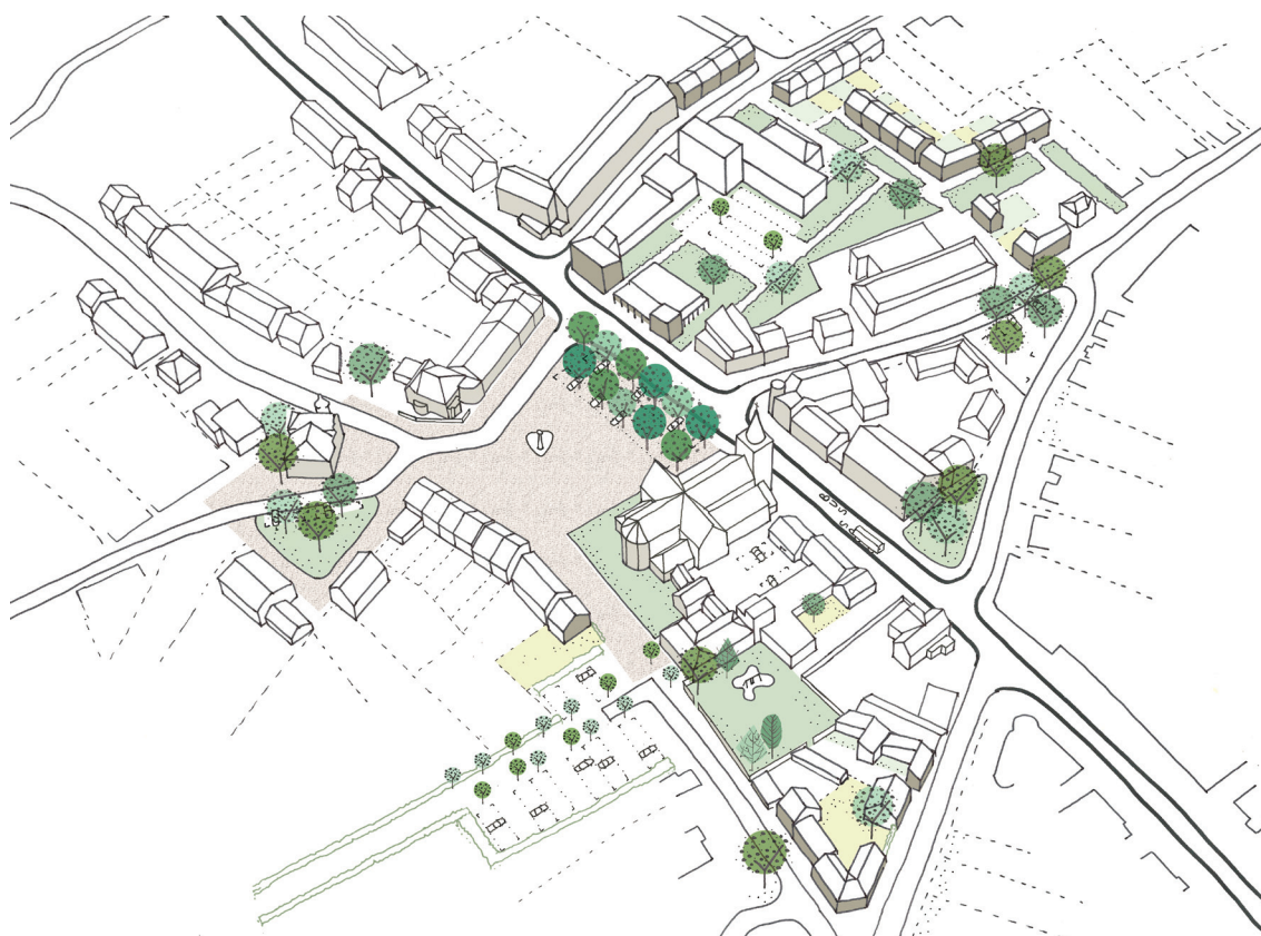
LINKS: beeld van de vernieuwde dorpskern van Dessel, waar nieuwe gebouwontwikkelingen de pleinruimte van de markt aanhelen.